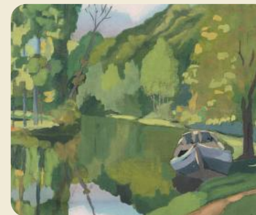
Peinture de Jean Urvoy

Très souvent, un moulin à vent était construit à proximité pour permettre au meunier de continuer à moudre lors des marées de faible amplitude (mortes-eaux).