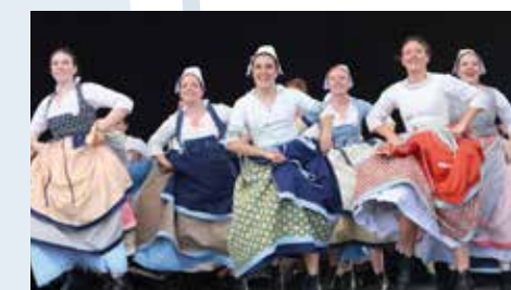
Le Festival de la Saint-Loup à Guingamp , une des plus anciennes fêtes de Bretagne

Le site de Lan Bern est une Réserve Naturelle où vivent pas moins de 85 espèces d'oiseaux. Au cœur de bruyères et de bocages, ressourcez-vous dans ce cadre atypique. Les amateurs de balades seront séduits par une boucle de 11 km. Le « plus » ? Un petit circuit de 2 km accessible aux poussettes et aux personnes à mobilité réduite.