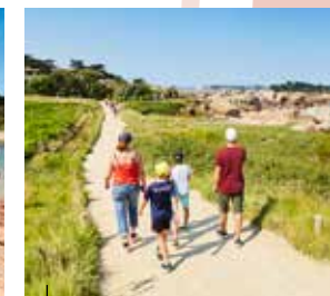
Perros-Guirec Balade sur le GR®34