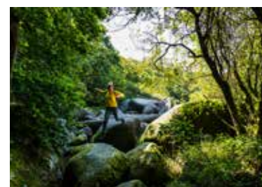
Sautez de rocher en rocher dans les Gorges du Corong

La Biscuiterie Menou, fabricant artisanal de pâtisseries bretonnes depuis 1879, a reconstitué, dans sa boutique, les commerces d'antan aux vitrines joliment décorées, le tout dans une ambiance parfumée au palet breton. Une visite incontournable pour les curieux et les gourmands!