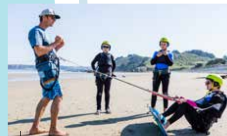
Pléneuf-Val-André Cours de Kitesurf sur la plage

Découvrez la forteresse du Fort La Latte, édifiée au XIV e siècle sur un éperon rocheux et se dressant face à la mer. Pont-levis, murailles, oubliettes, et engins de guerre, petits et grands voyageront dans le temps lors de cette visite incontournable.