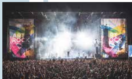
Le festival Art Rock a lieu chaque année dans le centre-ville de Saint-Brieuc

Pendant votre balade sur le GR®34, du haut des vertigineuses falaises de Plouha, vous découvrirez le petit port de Gwin Zegal. À marée haute, admirez les bateaux amarrés aux pieux de bois. À marée basse, descendez sur la plage et promenez-vous sur ce port typique, l'un des derniers de son genre en Europe!