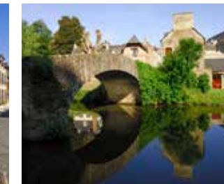
Léhon Le petit pont de la Rance