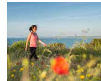
La Pointe du Roselier entre plage et vallée boisée