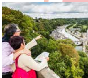
Point de vue sur la Vallée de la Rance depuis les Remparts