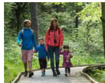
La grande forêt d'Avaugour et ses nombreux circuits

En Côtes d'Armor, la diversité des paysages est un réel atout pour randonner d'Est en Ouest.. Sentier des douaniers, estuaires, vallées boisées, dunes, landes, lacs et canaux... sont autant d'univers pour changer d'air. Par exemple, ces 4 circuits de randonnées pédestres sont incontournables.