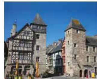
Tréguier Capitale historique du Trégor

Sans vous y attendre, vous venez de pénétrer dans un village labellisé. Le charme opère à mesure que vous découvrez ses ruelles pittoresques. Vous avez la sensation de voyager dans une autre époque. Là, des remparts, ici, des maisons à colombages. Un charme médiéval, une capitale de la mode, une cathédrale monumentale, chaque village a sa particularité et réveillera en vous des sentiments différents. Neuf Petites Cités de Caractère vous attendent en Côtes d'Armor, découvrez-les et laissez-vous charmer!