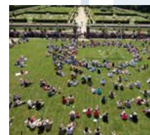
Le Festival Lieux Mouvants réunit de nombreux talents à Lanrivain