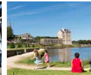
Quintin La médiévale