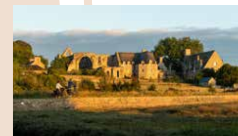
Balade à vélo jusqu'à l' Abbaye de Beauport

Connu dans le monde entier pour la maison entre les rochers, le site de Castel Meur est d'une rare beauté. Ce lieu capricieux impressionne par la force et la rudesse de son paysage. Empruntez le sentier des douaniers jusqu'au Gouffre de Plougrescant. La mer s'engloutit dans cette énorme faille rocheuse, vous offrant un spectacle saisissant.