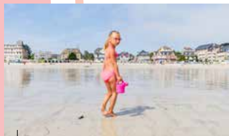
Farniente sur la plage de Saint-Cast-le-Guildo

C'est un véritable petit bijou qui prolonge la presqu'île de Saint-Jacut-de-la-Mer, ancien village de pêcheurs. Installé à la pointe du Chevet, la magie des lieux vous transportera vers de lointaines contrées. À marée basse, rejoignez à pied ce petit coin de paradis. Vous y trouverez des plages de sable fin et une eau couleur émeraude.