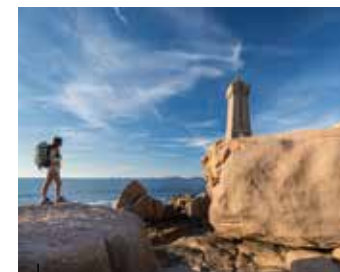
Ploumanac'h au milieu des rochers de granit rose