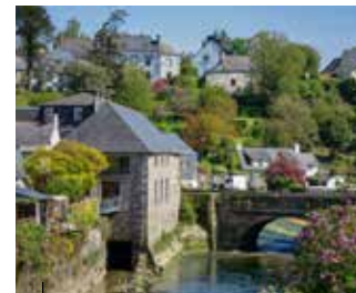
La Roche Derrien Ancienne cité d'artisans du lin et de l'ardoise