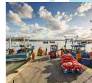
Port d'Erquy Retour de pêche à la Coquille Saint-Jacques