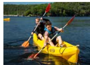
Base de plein air de Guerlédan Faites le plein de sensations

Envie d'une balade bucolique en famille? Rejoignez l'Abbaye de Bon Repos et empruntez à vélo le chemin de halage du Canal de Nantes à Brest. D'une écluse à l'autre, au fil d'une nature préservée, vous découvrirez les richesses du patrimoine et de la culture du Kreiz Breizh (Centre Bretagne en breton).