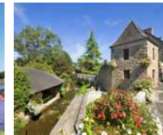
Jugon-les-Lacs La cité nature