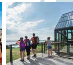
La Réserve Naturelle de Saint-Brieuc abrite pas moins de 40 000 oiseaux