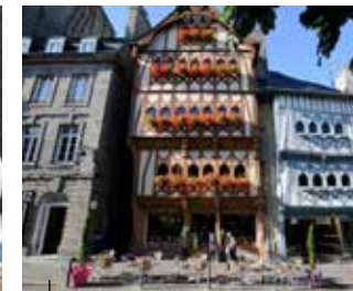
Guingamp La ville des marchands