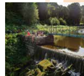
Canal de Nantes à Brest Halte réparatrice le long du Canal