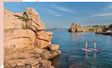
La Côte de Granit Rose en paddle

L'île Renote saura vous charmer avec ses grandes plages de sable fin et ses majestueux rochers roses. Une pluie de granit se serait-elle abattue sur les lieux? Mystère... Dans ce petit paradis idéal pour s'adonner au farniente et aménagé pour des balades en famille, choisissez le programme qui vous convient!