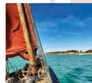
Larguez les amarres et hissez les voiles vers l' Archipel de Bréhat