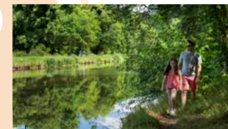
Randonnée à pied Le long du Canal de Nantes à Brest