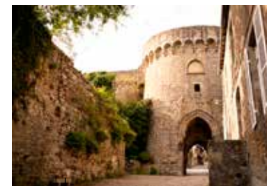
La porte de Jerzual et ses remparts, une des entrées historiques de Dinan