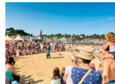
Le festival Place aux Mômes à Binic réjouira petits et grands

« Shelburn » est un réseau de résistants créé en 1943 pour secourir les pilotes anglais et les aider à regagner leurs terres. Sur un circuit de 3,5 km à flanc de falaise, guidé par une application mobile, découvrez cette organisation qui a bouleversé le destin de 142 hommes.