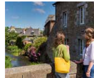
Châtelaudren Une ville à la mode