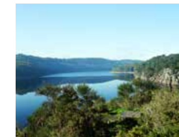
Le tour du Lac de Guerlédan et ses panoramas