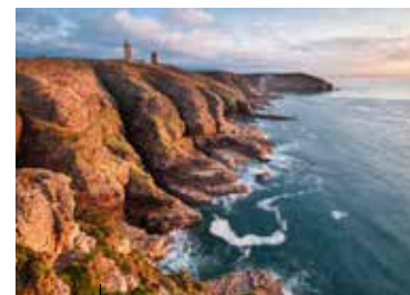
Le Phare du Cap Fréhel Guide des navigateurs qui traversent la Baie de Saint-Brieuc

Cap d'Erquy – Cap Fréhel a été labellisé Grand Site de France en septembre 2019 pour une durée de 6 ans. Une belle reconnaissance du travail de protection et de valorisation des paysages et de la biodiversité, et la garantie de sa sauvegarde sur le long terme.