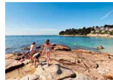
Trébeurden Baignade dans une mer cristalline

Embarquez à bord d'une vedette et naviguez autour des 7 îles qui composent cet archipel. Vous découvrirez un spectacle unique en France. Parmi les 27 espèces d'oiseaux nicheurs qui peuplent cette réserve naturelle, vous observerez la seule colonie française de Fous de Bassan.