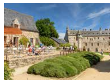
Excursion au Domaine de La Roche-Jagu

Installez-vous en terrasse de ce petit port de caractère, et observez les bateaux aller et venir au rythme des marées. Plongez à l'époque des corsaires et des pêcheurs d'Islande. En déambulant dans ses ruelles, vous sentirez l'âme de ce pays de marins, marqué par la « Grande Pêche ».