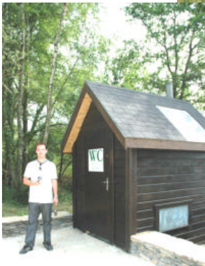
Toilettes sèches accessibles - parking Bois de Caurel-Goëno